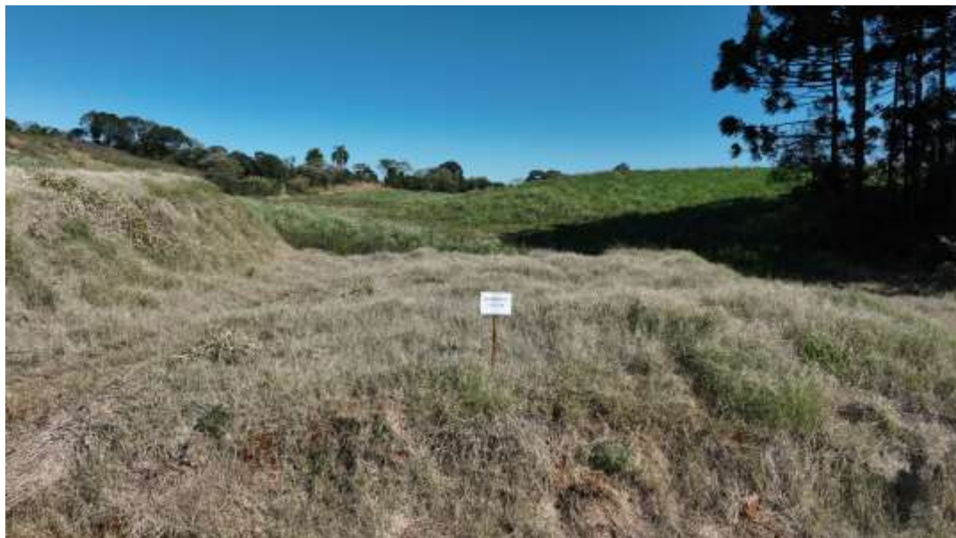
XVII. Matricula 13.508

IDENTIFICAÇÃO DO IMÓVEL: Lote 09 da quadra 04, com área de 220,27 m 2 , e a sua descrição; Noroeste: com o lote 10, em 16,96 m; Sudeste: com o lote 08, em 16,93 m; Nordeste: com a Rua B, em 13,00 m; Sudoeste: com parte dos lotes 12 e 14 de Luiz Domingos Sponchiado, Mat. 5.982, em 13,00m. avaliado em R$ 20.000,00 (vinte mil reais);