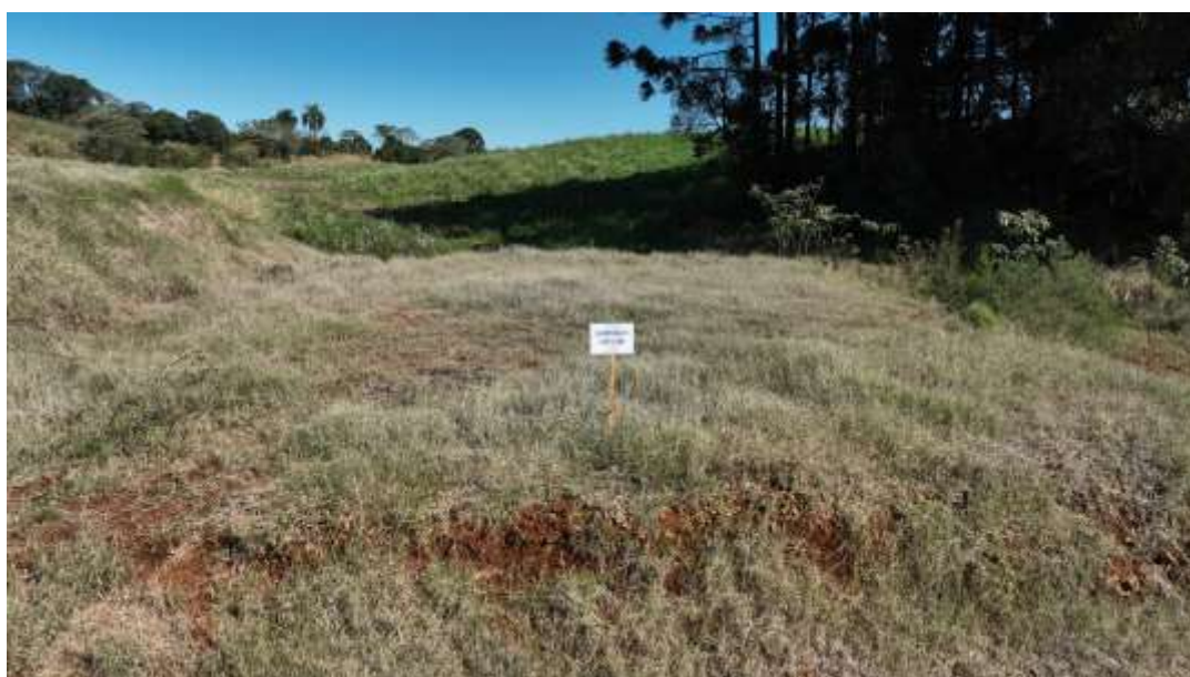
XVIII. Matricula 13.509

IDENTIFICAÇÃO DO IMÓVEL: Lote 09 da quadra 04, com área de 220,27 m 2 , e a sua descrição; Noroeste: com o lote 10, em 16,96 m; Sudeste: com o lote 08, em 16,93 m; Nordeste: com a Rua B, em 13,00 m; Sudoeste: com parte dos lotes 12 e 14 de Luiz Domingos Sponchiado, Mat. 5.982, em 13,00m. avaliado em R$ 20.000,00 (vinte mil reais);